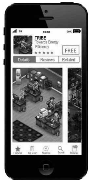
Abb. 8: Die sich in Entwicklung befindliche „TRIBE-App“

Die gewonnenen Erkenntnisse zum Verhalten von Gebäude-NutzerInnen sowie zu möglichen Treibern für Verhaltensänderungen fließen in die Spieleentwicklung mit ein. Im Spiel selbst steuern die SpielerInnen einen oder mehrere Avatare und schlüpfen dabei in verschiedene Rollen – von GelegenheitsbesucherInnen bis zu HausmeisterInnen. Der Spielmodus erlaubt dabei sowohl Kooperation als auch Wettbewerb mit anderen SpielerInnen. Interessant aus wissenschaftlicher Sicht ist dabei zum einen, wie die im Spiel implementierten Maßnahmen (zum Beispiel Feedback zum eigenen Energieverbrauch und dem Verbrauch anderer) auf das Verhalten im Spiel wirken. Zum anderen drängt sich natürlich die Frage auf, wie positive Verhaltensveränderungen im Spiel bestmöglich auf die reale Welt übertragen werden können und welche Mechanismen hierfür notwendig sind. Erste Ergebnisse des Projekts werden im Jahr 2016 erwartet.